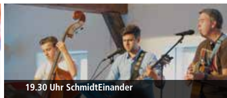
19.30 Uhr SchmidtEinander