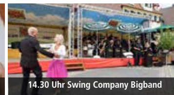
14.30 Uhr Swing Company Bigband