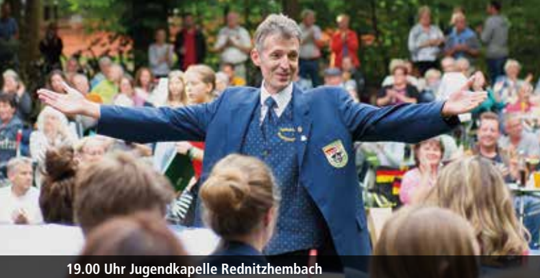
19.00 Uhr Jugendkapelle Rednitzhembach