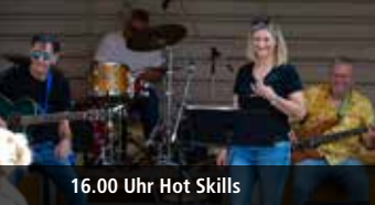
16.00 Uhr Hot Skills