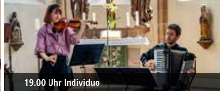
19.00 Uhr Individuo