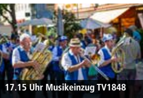
17.15 Uhr Musikzug TV1848