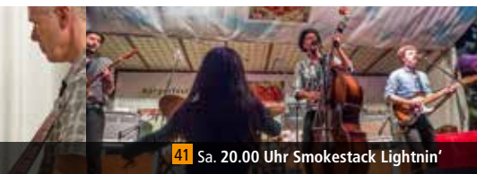
41 Sa. 20.00 Uhr Smokestack Lightnin'