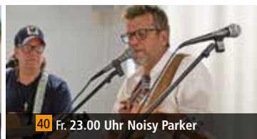
40 Fr. 23.00 Uhr Noisy Parker