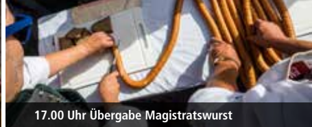
17.00 Uhr Übergabe Magistratswurst