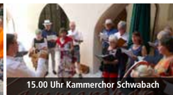
15.00 Uhr Kammerchor Schwabach