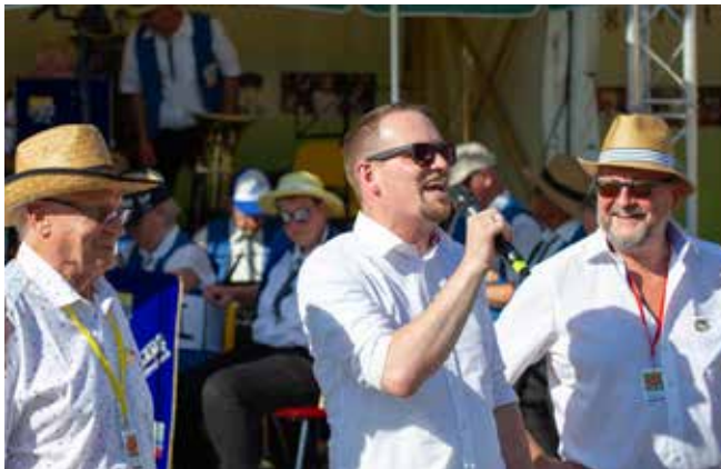
23.30 Uhr Programmende des ersten Tages des 44. Schwabacher Bürgerfests... gern weiter essen und trinken bis 0.30 Uhr.