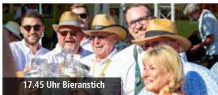
17.45 Uhr Bieranstich