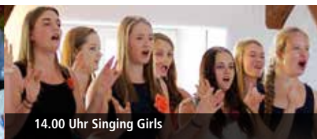
14.00 Uhr Singing Girls